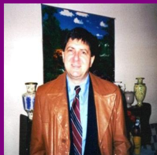
مؤسس علم النيتروسوفيك العالم فلورنتين سمارانداكه