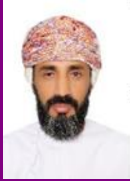
خليفة بن زايد الشقسي

Department of Mathematical and Physical Sciences, College of Arts and Sciences