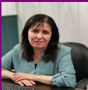
مؤلف الكتاب الدكتورة: ميسم أحمد جديد