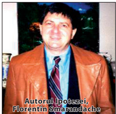
Autorul Ipotezei, Florentin Smarandache

În 6 octombrie 2011, ziarul Monitorul de Vâlcea a publicat articolul „Profet în Țara Fizicii: Smarandache confirmat, Einstein infirmat?”, în care arătam că un experiment științific numit „Experimentul OPERA”, efectuat de către o echipă de savanți de la CERN (inițial, numit Centrul European de Cercetări Nucleare, acum, Laboratorul European pentru Fizica Particulelor Elementare) din Geneva (Elveția), a demonstrat că particulele elementare neutrino se deplasează cu o viteză mai mare decât cea a luminii, ceea ce infirmă celebra Teorie a Relativității Restrânse, enunțată de fizicianul Albert Einstein (viteza luminii este viteză limită în Univers) și, deci, confirmă „Ipoteza Smarandache” (nu există viteză limită în Univers), enunțată în anul 1998 de către matematicianul vâlcean Florentin Smarandache, născut la Bălcești, în anul 1954.