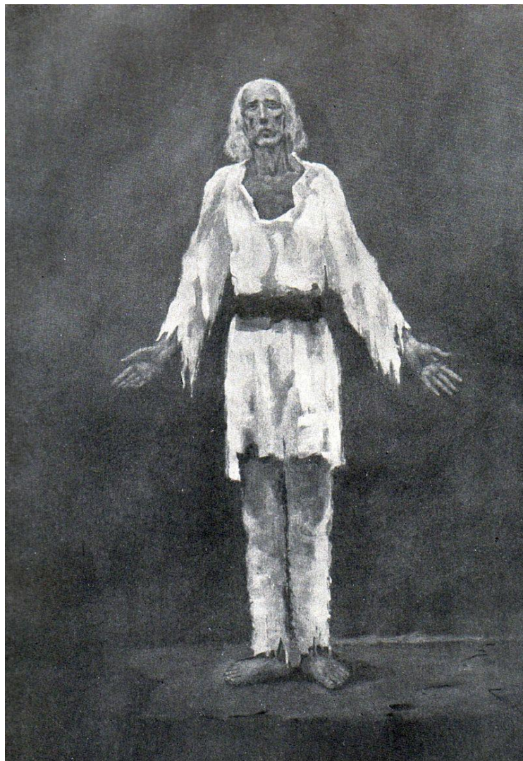
Octav Băncilă: Înainte de 1907

Reproducere după: Anton Coman (Pseudonimul lui Petru Comarnescu) - OCTAV BĂNCILĂ; Editura de Stat pentru literatură și artă, București, 1954