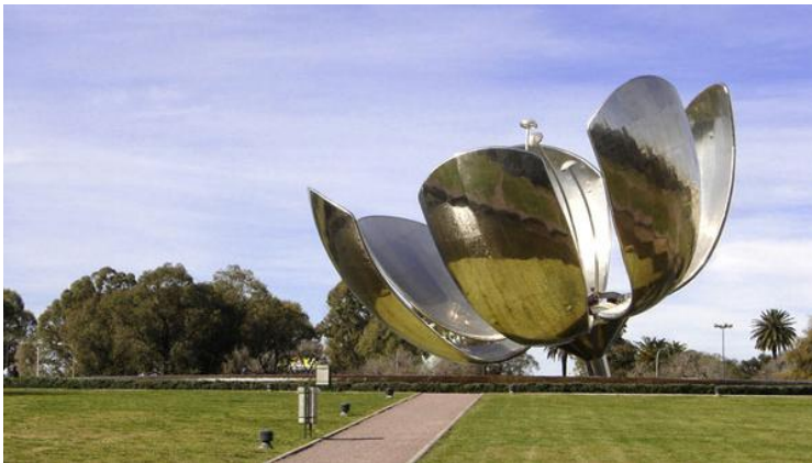
Floarea de aluminiu a lui Eduardo Catalano

Plaza de Las Naciones Unidas . Se întinde pe patru hectare. La mijloc, «La Flor», monument emblematic ridicat de arhitectul Eduardo Catalano.