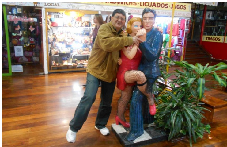
Buenos Aires, orașul tangoului

Dansuri pe stradă. ¡Que hermoso! Doar suntem în țara tangoului... Există și Academia Nacional del Tango, chiar lângă hotelul nostru, pe Avenida De Mayo.