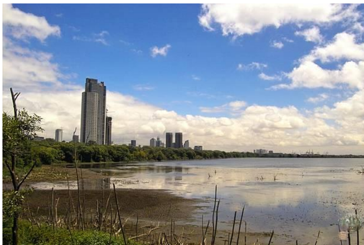
Laguna de los Patos, Buenos Aires

Din Amazonia în Pampas (fotojurnal instantaneu)