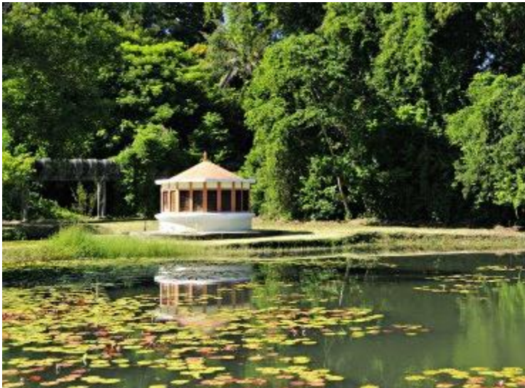
Imagine din Jardim Botânico

Jardim Japonês (Grădina japoneză) a fost creată în 1835 în urma aducerii la Rio a 65 de specii de plante nipone.