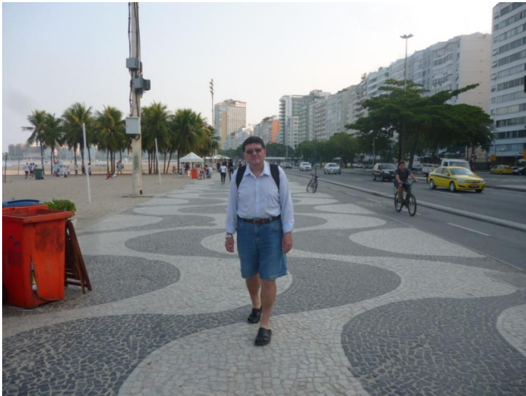
Copacabana, Rio de Janeiro

Cu autobuzul 502 mergem în Copacabana, cartier al orașului Rio de Janeiro, cu o celebră plajă plină de lume și o faleză splendidă.