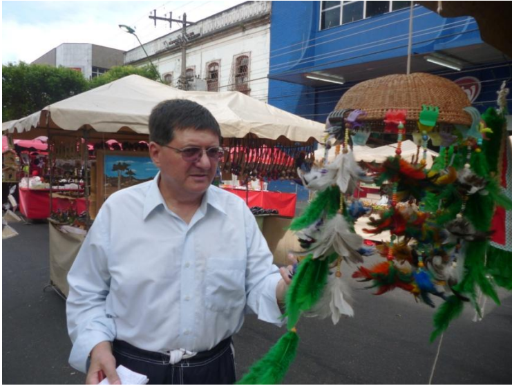
Bâlciul duminical din Manaus

Campionatul Mondial de Fotbal 2014 se va ține în Brazilia, care-a câștigat până acum de cinci ori Campionatul Mondial.