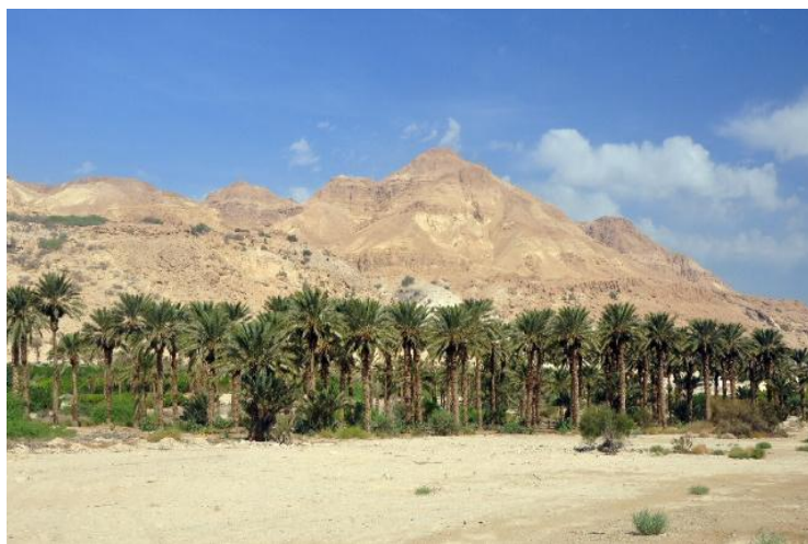
Pepinieră de palmieri

Naipi a fost pedepsită să rămână o stâncă, bătută de apele ce cad în locul denumit Beregata Diavolului, din cadrul cascadelor Iguaçu, iar Tarobá a fost transformat într-un palmier, care să o contempleze pe Naipi .