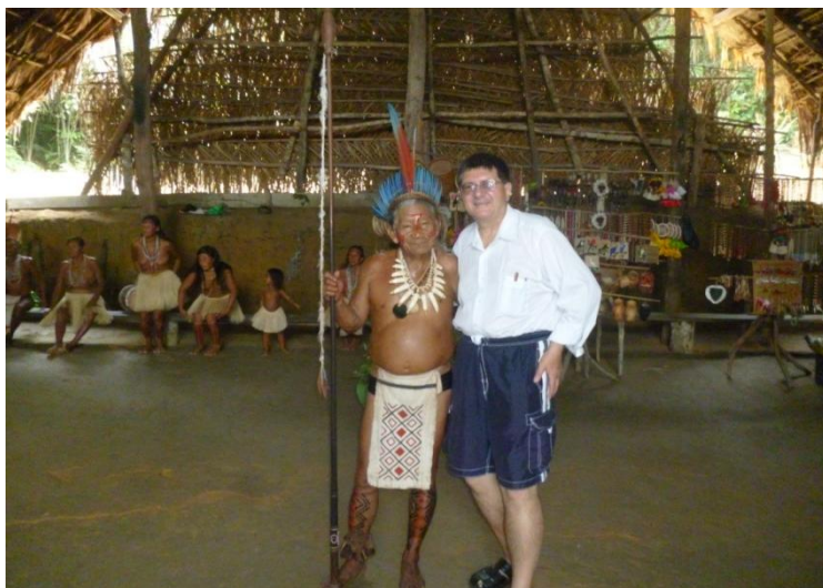
Autorul, cu Șeful tribului Tokano

Valurile sunt roșii la mal. Mai mult exotic, decât frumos. Mai mult interesant, decât incitant.