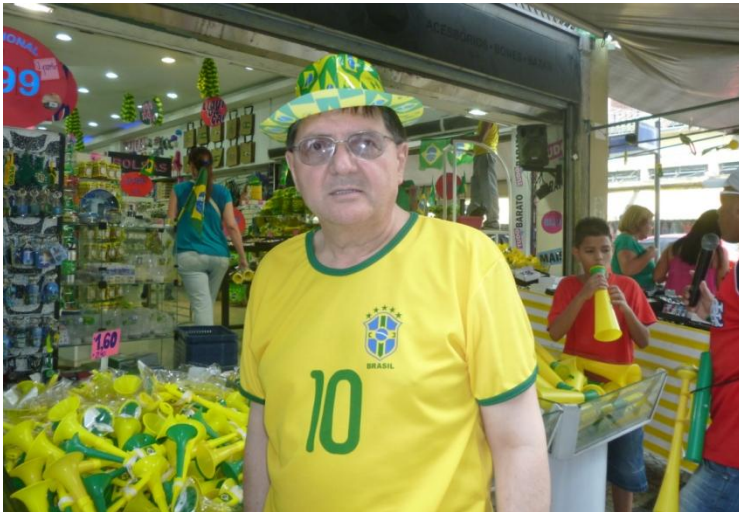
Autorul, vârf de atac al multiplei campioane mondiale, Brazilia (!)