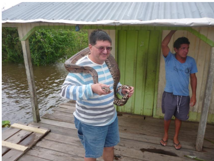
Autorul, cu o cobra giboia după gât

Jungla este puțin populată, iar între așezările ome-nești nu sunt șosele. Se circulă pe canale de apă sau cu avionul.