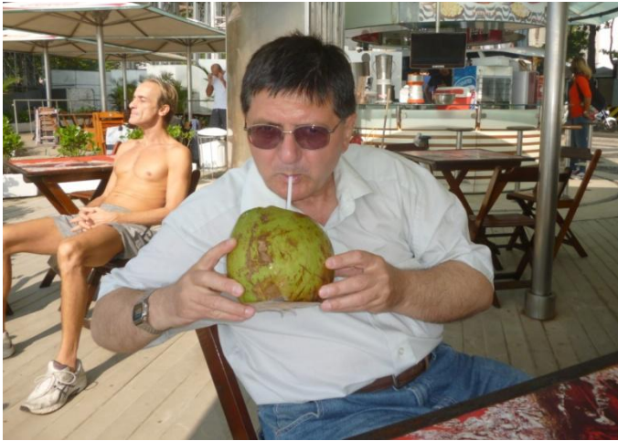
Autorul, consumând suc de cocos

Etimologic, cuvântul Pantanal vine de la cuvântul portughez pântano , care înseamnă teren ud, mocirlă. Sezonal, regiunea este inundată, apoi desecată.