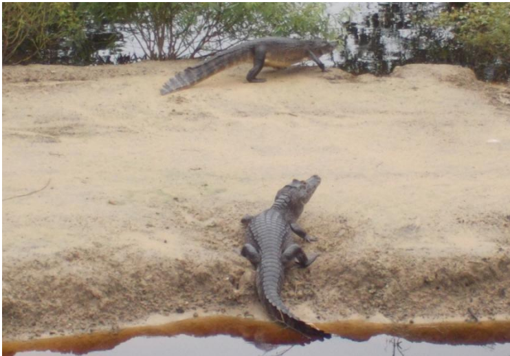
Caimani în Pantanal

caimanii sunt vânați pentru pielea lor și pentru carne, dar, de când au fost ocrotiți de lege, s-au înmulțit prea mult; în portugheză, se numesc jacaré ; caimanii nu atacă deloc oamenii, în schimb sunt mâncați de peștii piranha , care, deși mult mai mici, atacă în grup;