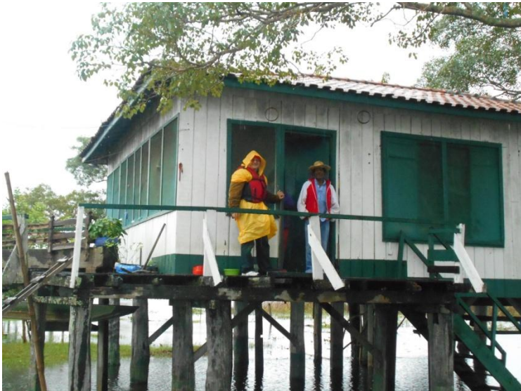
O casă flotantă ( flutuante ipuxuna ) în Pantanal, Brazilia

După alte surse cercetate, am găsit date diferite.