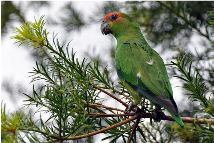
Cuiú-cuiú în Parque das Aves