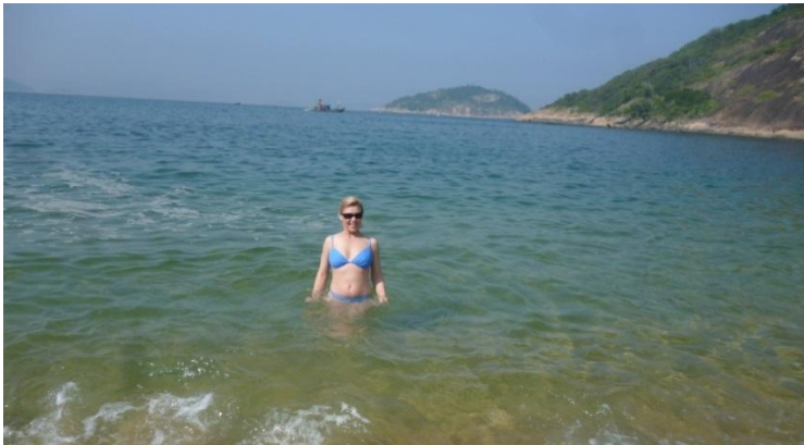
Praia Urca din Rio de Janeiro