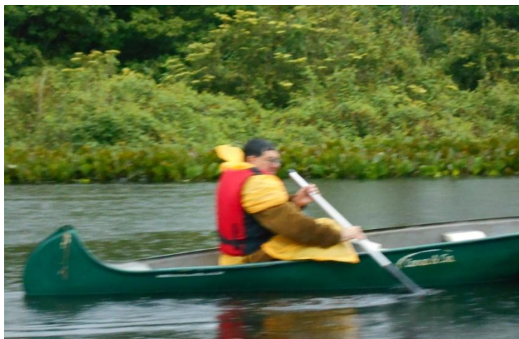
În canoa, pe Pantanal