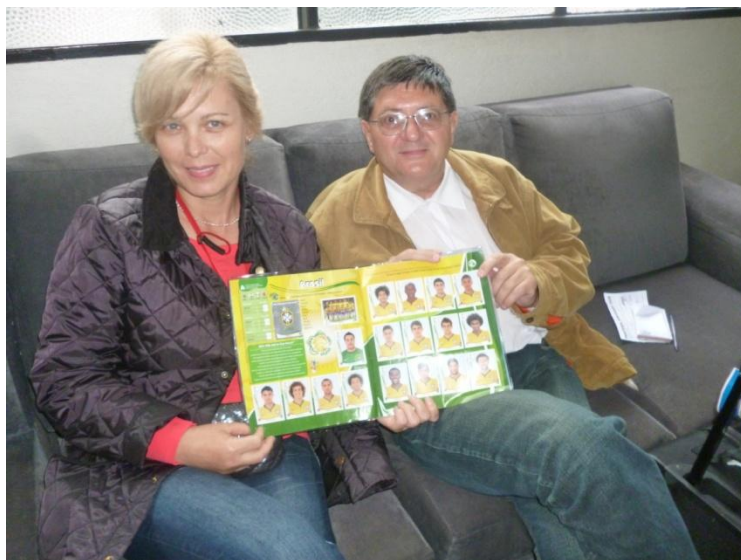
Echipa Braziliei de la Copa Do Mundo 2014

Din Amazonia în Pampas (fotojurnal instantaneu)