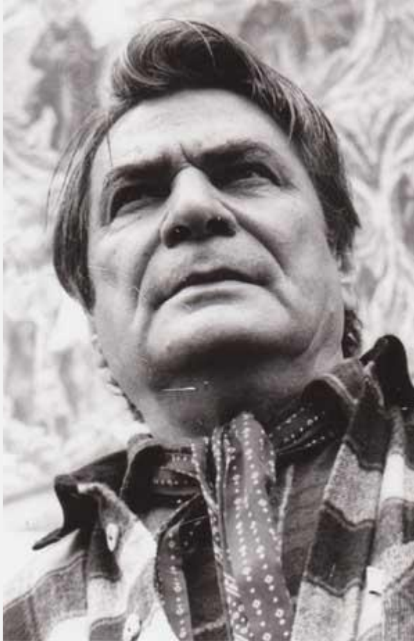
Constantin Țoiu (1923-2012)