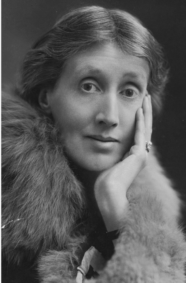
Virginia Woolf (1882-1941)