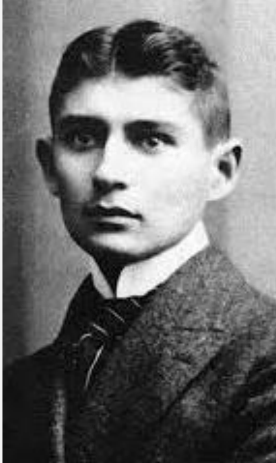
Franz Kafka (1883-1924)