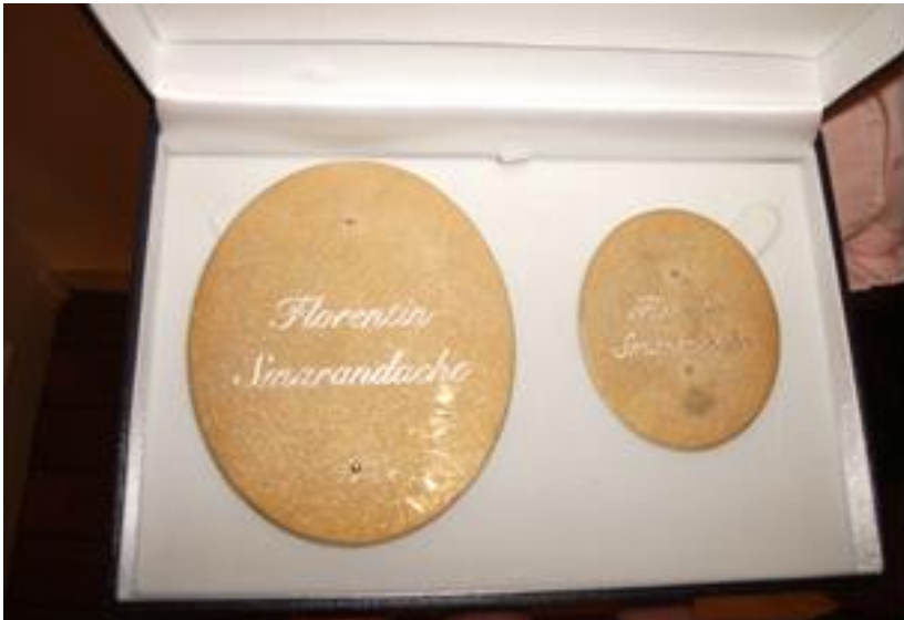
Medalia de aur, 12.06 2010, Univ. din Pécs