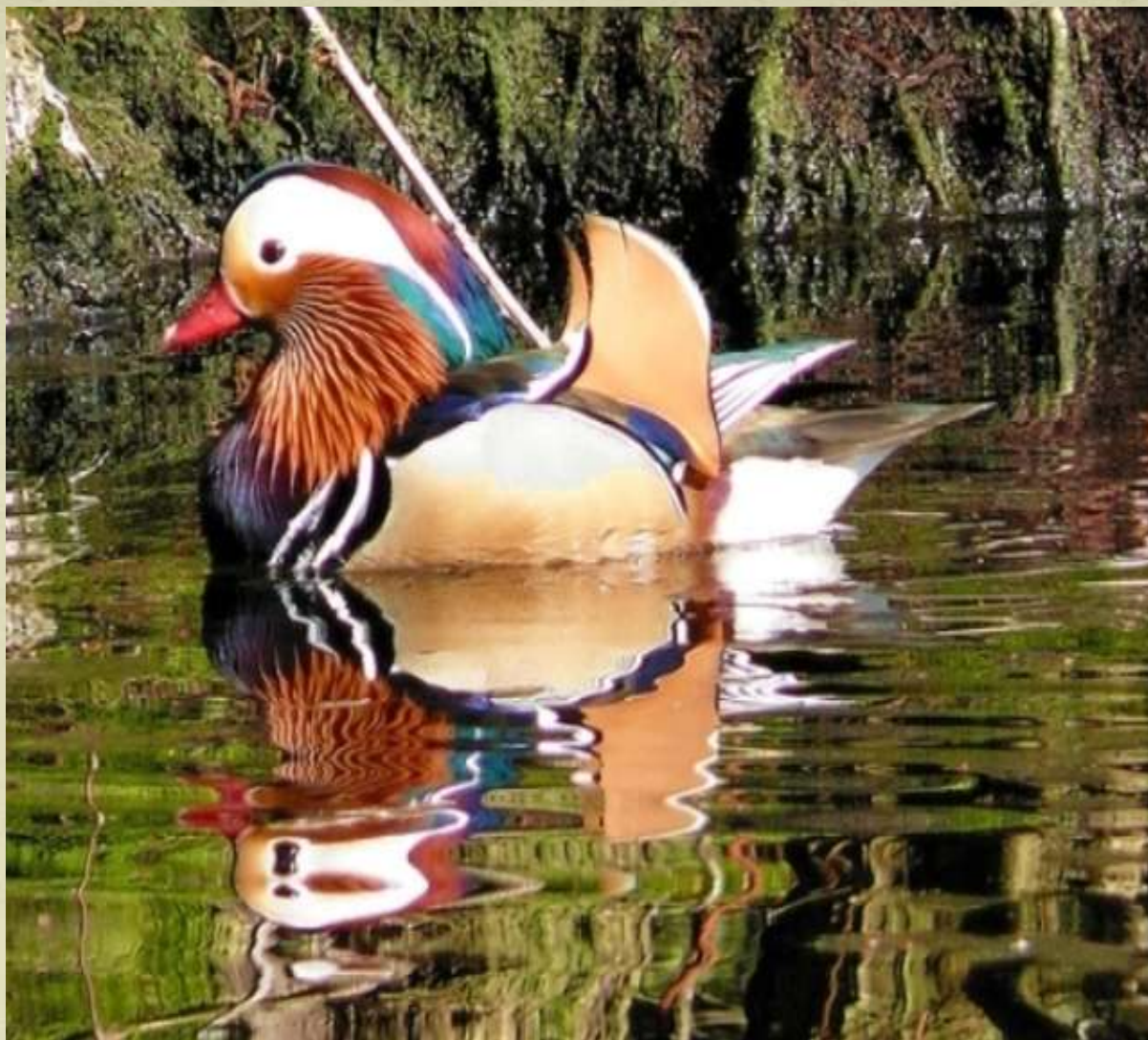
Culori în oglindă (pasărea Mandarin)