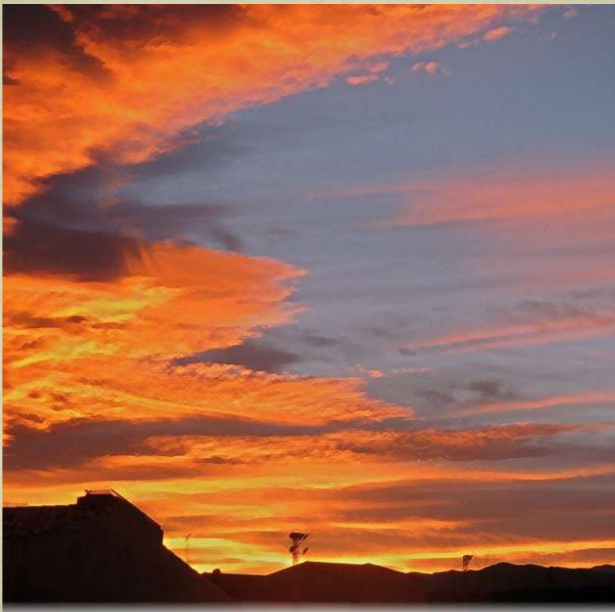
Apus de soare în La Jana, Spania