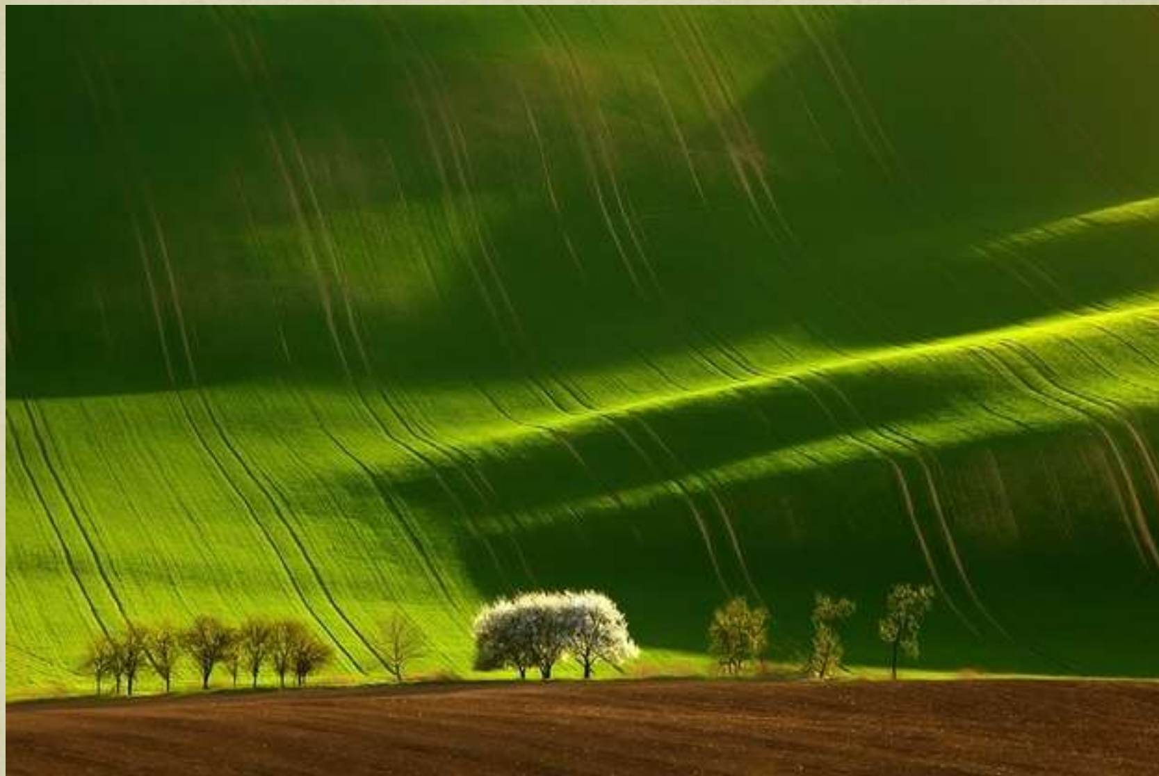
Câmpuri în Moravia, Cehia