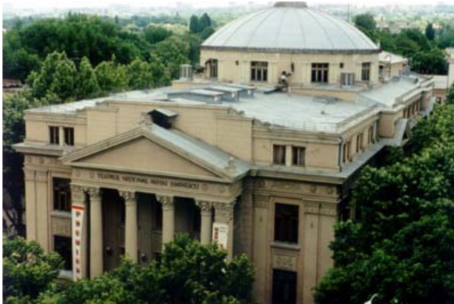
Teatrul Național "Mihai Eminescu" din Chișinău