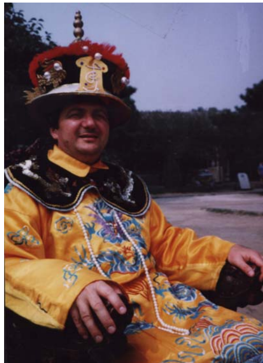
Florentin Smarandache “împărat chinez al cifrelor” - amintire de la Congresul Internațional al Matematicienilor, Beijing, 2002