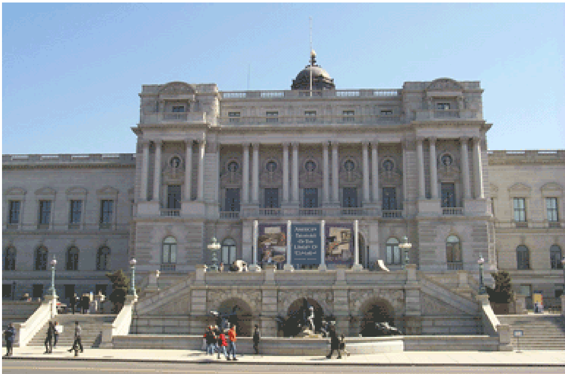
Clădirea "Jefferson" a Bibliotecii Congresului