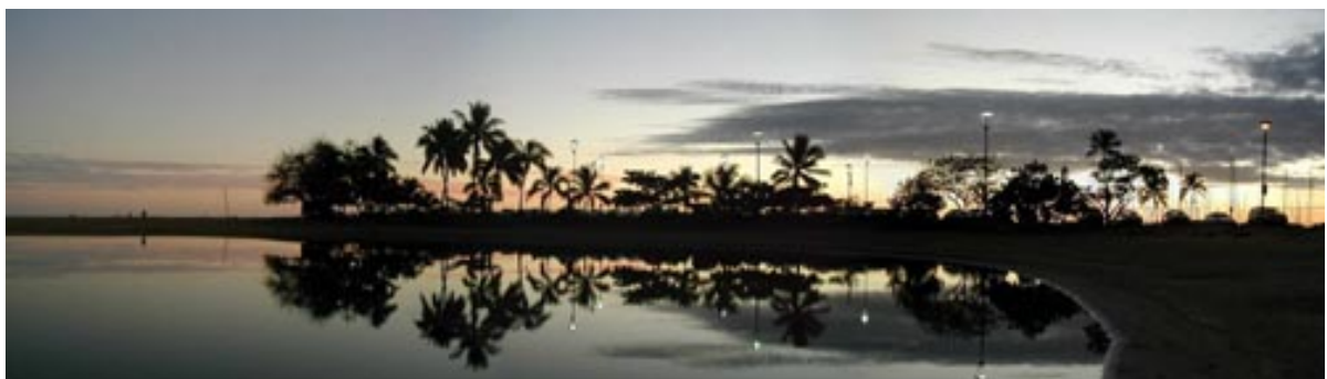
Amurg de vis în paradisul hawaiian