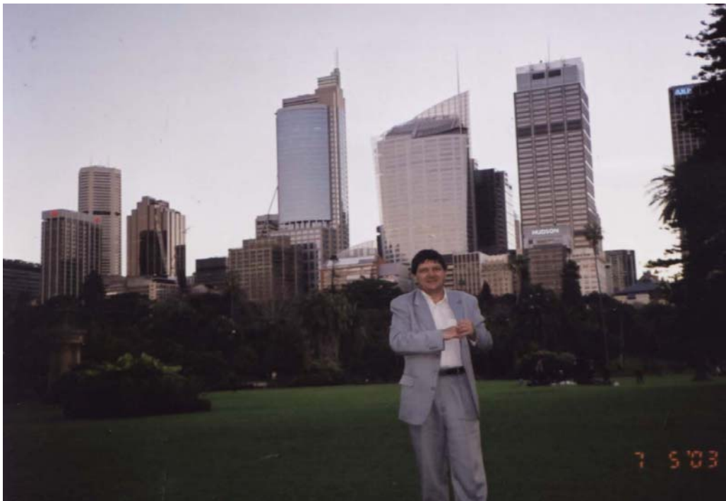
Florentin Smarandache pe un fundal newyorkez din Sydney, Australia, 2003