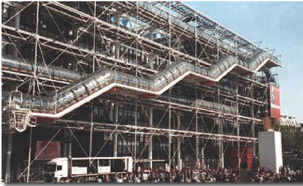
Beaubourg - un muzeu ca o... rafinărie!