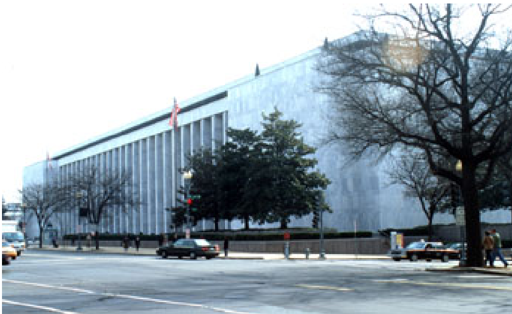
Clădirea "Madison" a Bibliotecii Congresului