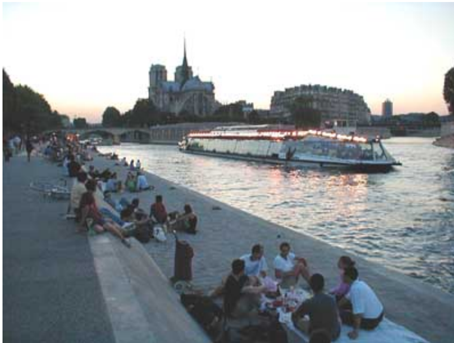
Amurg cu Notre Dame, pe cheiul Senei, Paris, 1992