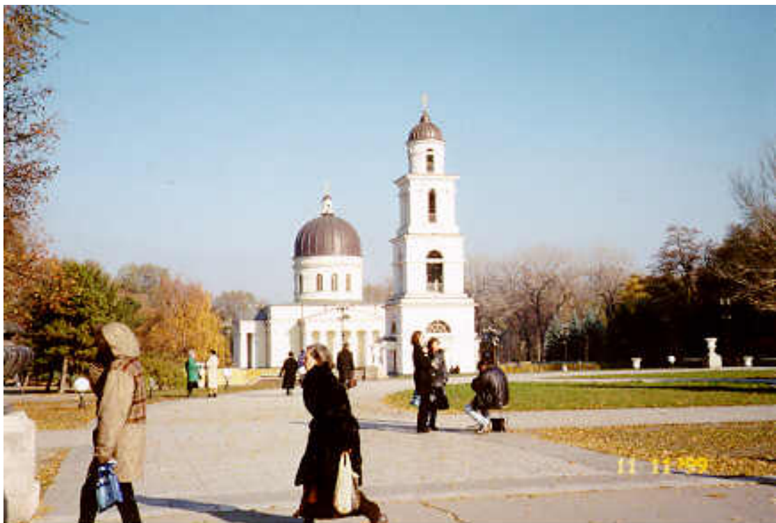
Catedrala din Chişinău (prim plan, turnul clopotniței)