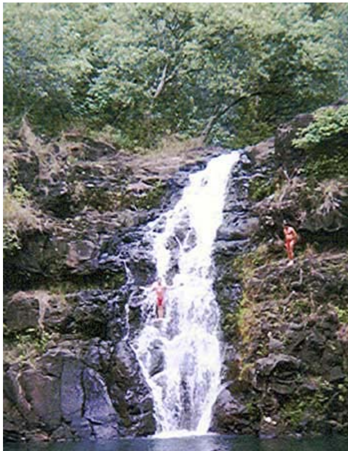
Un "duș" în vârtoarea Cascadei Waimea, Hawaii