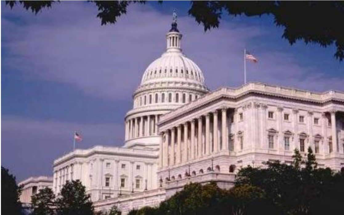
Clădirea Congresului SUA