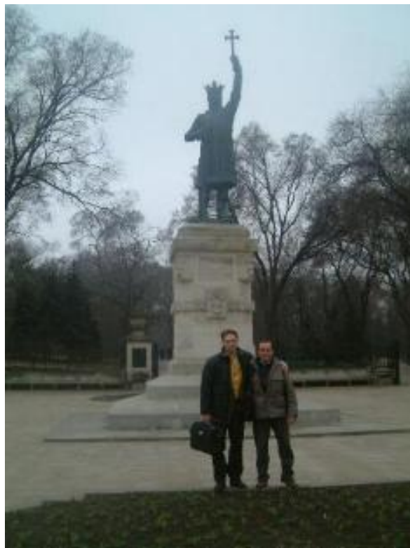
Amintire din Chișinău cu statuia lui Ștefan cel Mare