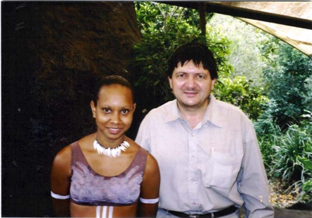
Florentin Smarandache cu o aborigenă din Kuranda, Queensland, Australia, 2003