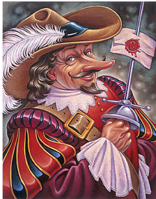
Cyrano de Bergerac - omul și eroul literar