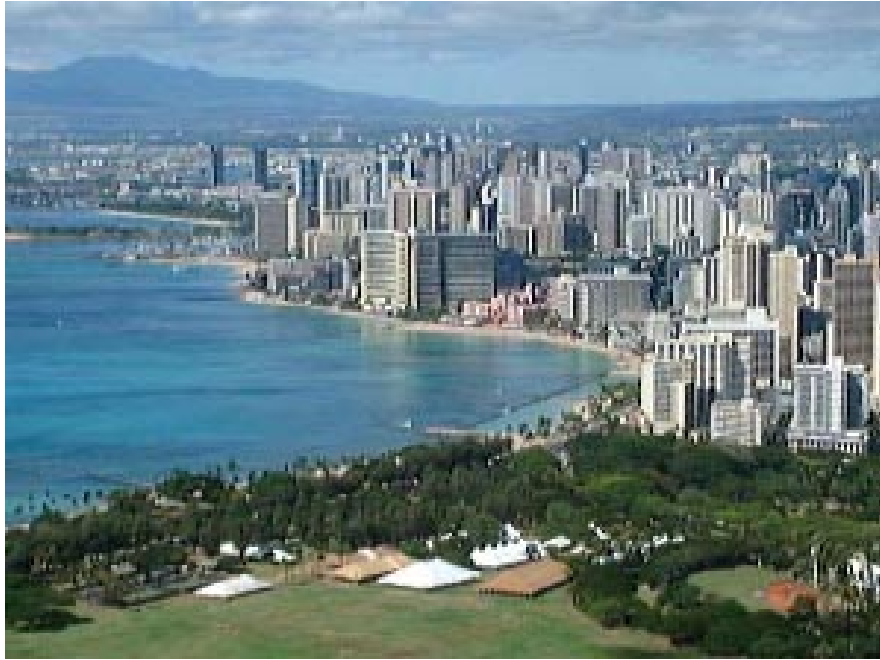
Waikiki, cel mai select cartier din Honolulu, capitala hawaiiană