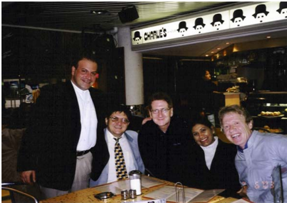
Florentin Smarandache cu universitari de la "Griffith", Gold Coast, Australia, 2003