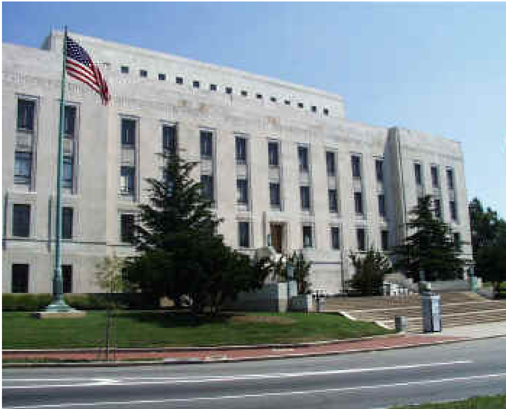
Clădirea "Adams" a Bibliotecii Congresului