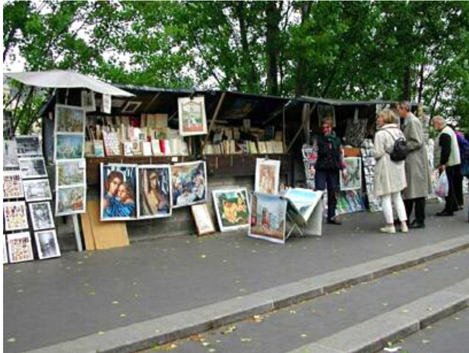
Un stand al celebrilor buchiniști de pe cheiul Senei, Paris, 1992