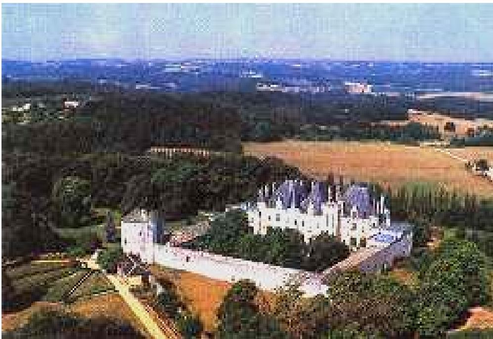
Castelul lui Montaigne, văzut din mașină, 1992