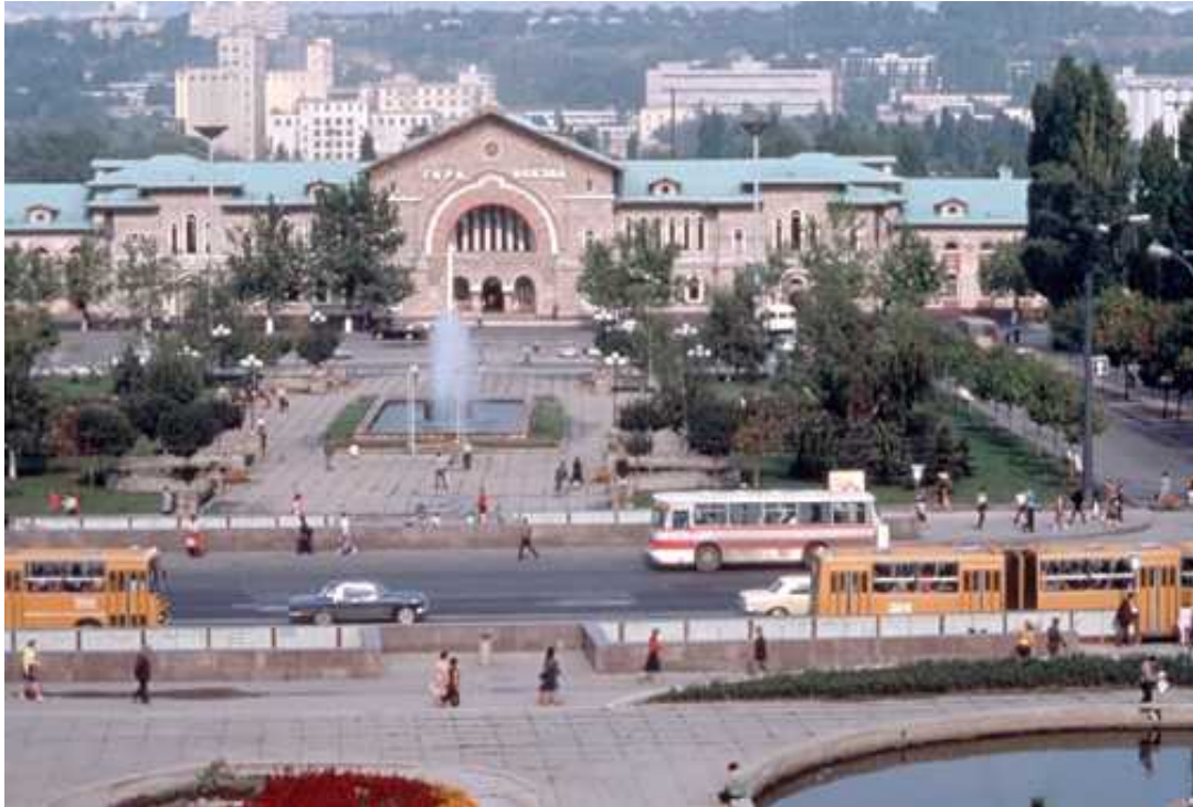
Gara din Chişinău