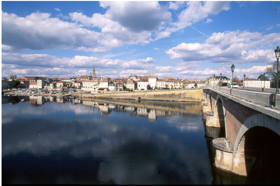
Aspect din centrul orașelului Bergerac, 1992