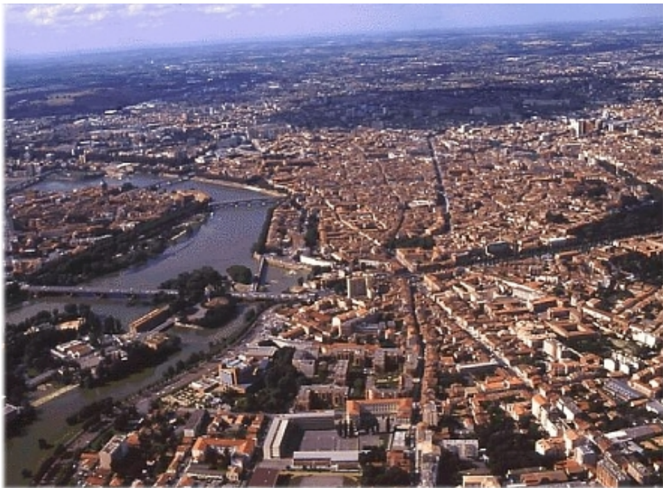
Vedere aeriană a orașului Toulouse, Franța, 1992