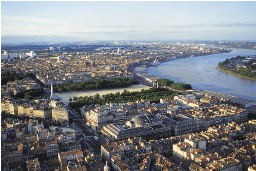
Vedere panoramică a orașului Bordeaux, Franța, 1992