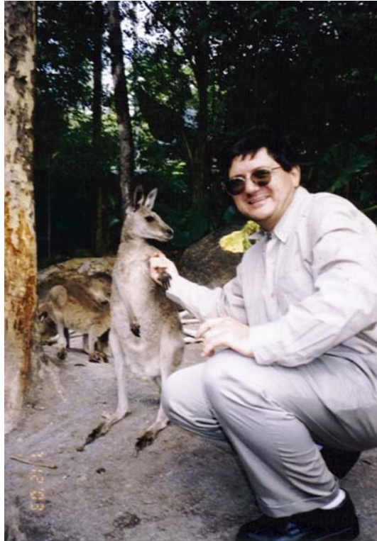
Florentin Smarandache “dă mâna” cu un cangur blând, Australia, 2003