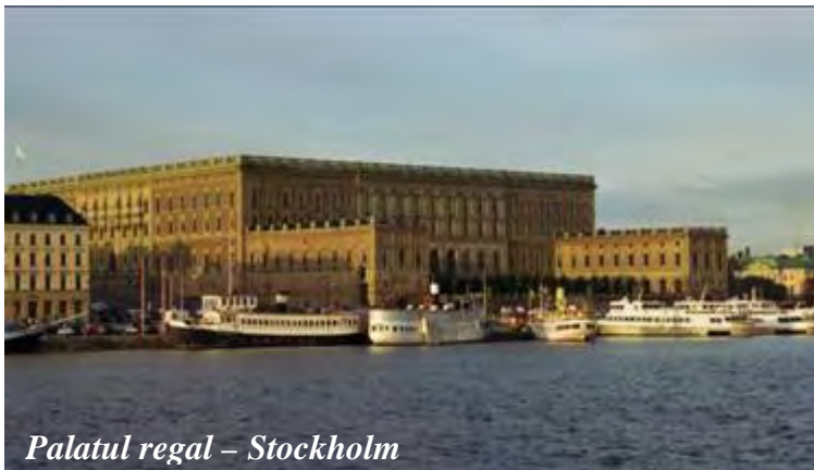
Palatul regal – Stockholm

Regele Suediei este Carl al XVI-lea Gustaf, de origine franceză (Dinastia Bernadotte). Regina Sylvia e de origine braziliano-germană. Are două fete și-un băiat. Regina, prima fată și băiatul sunt bruneți bine.