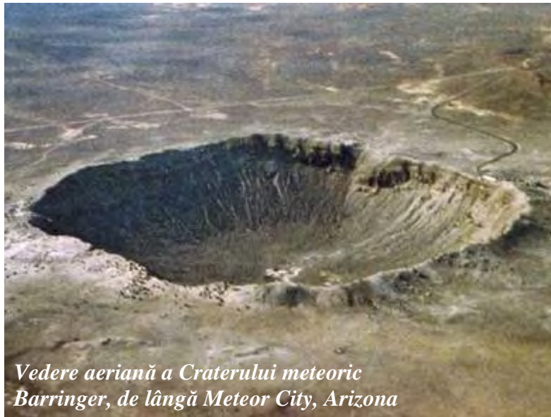
Vedere aeriană a Craterului meteoric Barringer, de lângă Meteor City, Arizona