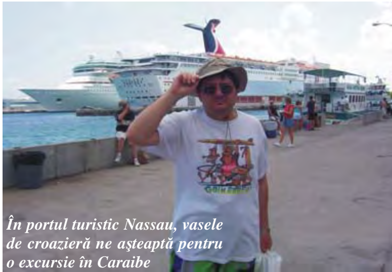
În portul turistic Nassau, vasele de croazieră ne așteaptă pentru o excursie în Caraibe