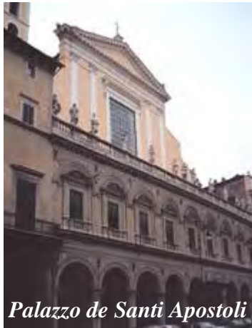
Palazzo de Santi Apostoli

Palazzo de Santi Apostoli (sec. XV), Capella della Madonna dell' Archetto .