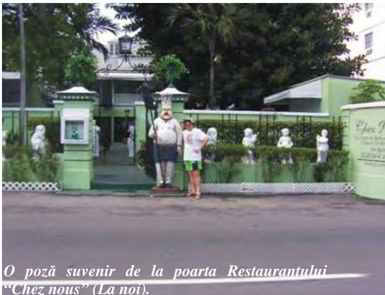
O poză suvenir de la poarta Restaurantului "Chez nous" (La noi).

Sunt rechini în apă, motiv pentru care lumea nu se avântă să înoate peste geamanduri.