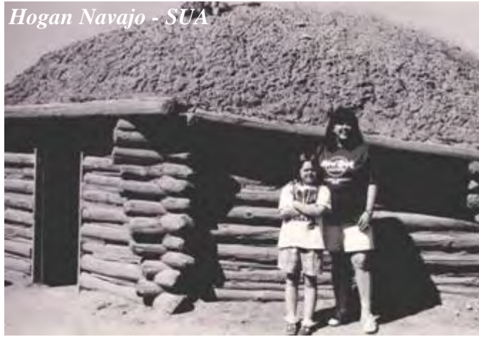
Hogan Navajo - SUA

Studentii Navajo la Anatomie n-au voie să practice disecții pe cadavre din motive religioase (de aceea nu-s medici Navajo).