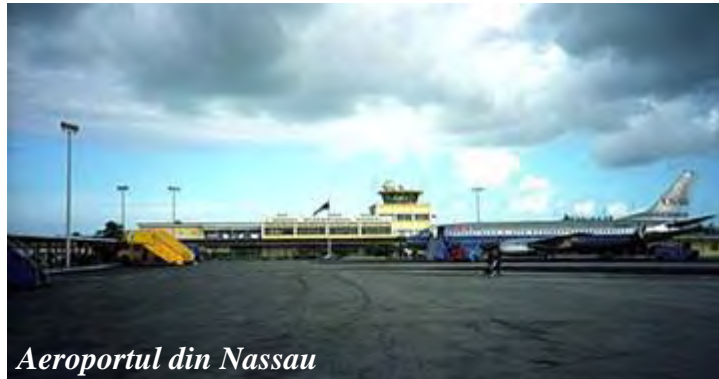
Aeroportul din Nassau

Fostă colonie britanică, Bahamas a devenit independentă în 1973, dar este membră a Commonwealth. Aeroportul este modest, organizarea este mai puțin eficientă – se-nchisese ușa iar pasagerii din avionul nostru nu puteau intra de pe pistă.