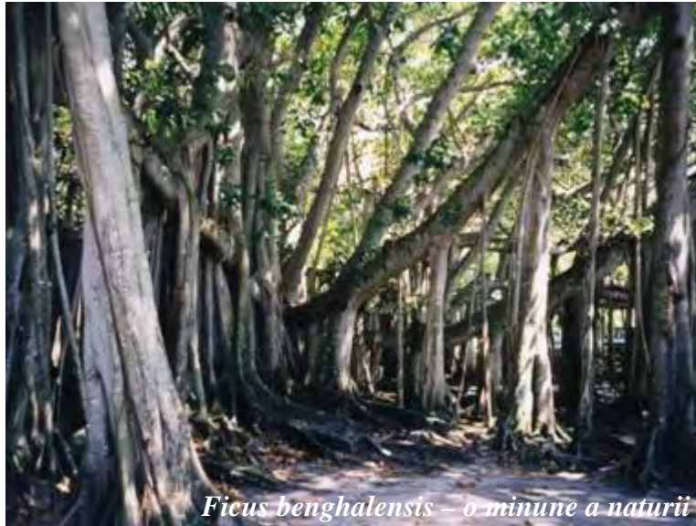
Ficus benghalensis – o minune a naturii

film – se întind de sus spre pământ și apoi se înfig în sol, se îngroașă și formează un arbore cu mai multe tulpini... dând aspectul unui monstru cu mai multe picioare!