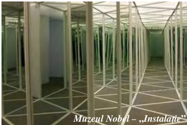
Muzeul Nobel – „Instalație”

Știința și tehnica influențând arta. De exemplu, banda lui Möbius l-a inspirat pe scriitorul Wole Soyinka: având numai o față, ea reprezintă atât simbolul esteticii și al adevărului, cât și al contradicțiilor - precum în mitologia Yoruban, Ogun este atât zeul creativității, cât și al războiului (distrugerii). Iată paradoxismul mitologic.