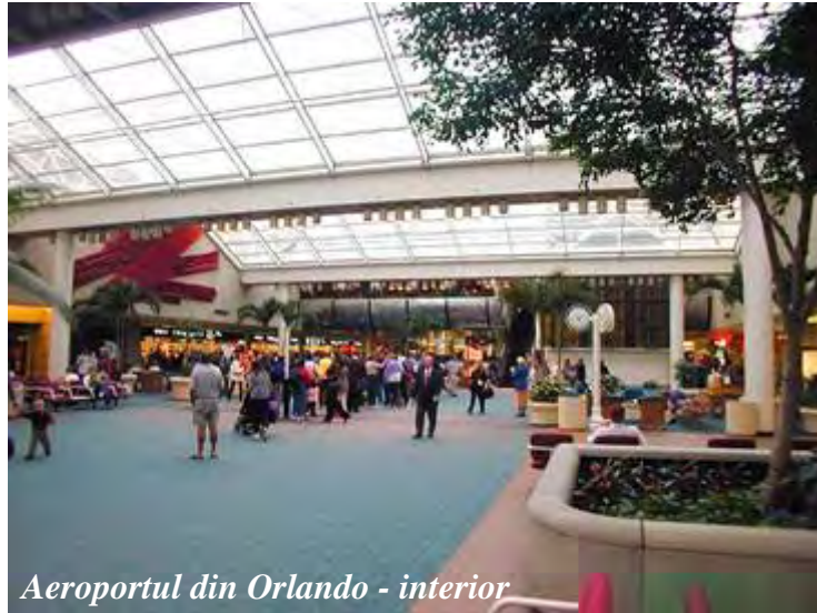
Aeroportul din Orlando - interior

Florida e plată și verde, ca o farfurie.