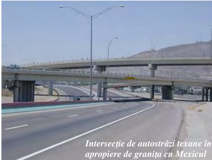
Intersecție de autostrăzi texane în apropiere de granița cu Mexicul