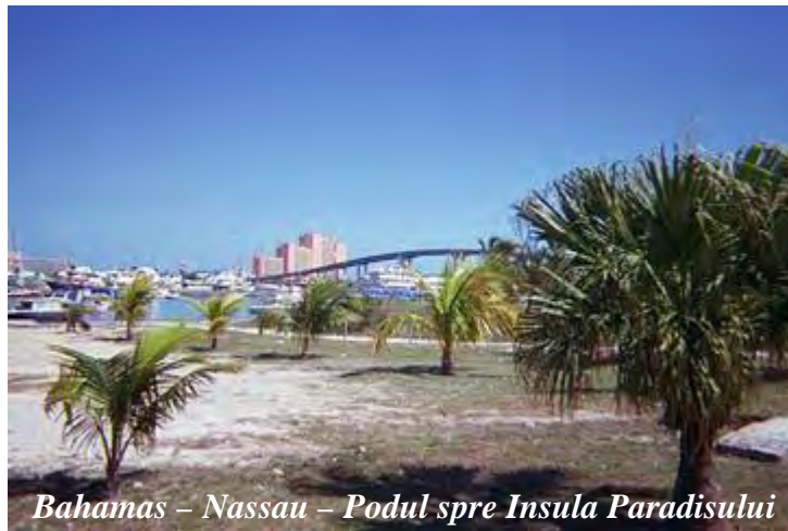
Bahamas – Nassau – Podul spre Insula Paradisului

Am mers pe Insula Paradisului, conectată printr-un pod înalt cu insula New Providence.