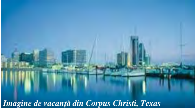
Imagine de vacanță din Corpus Christi, Texas

Două zile am zăcut, într-o noapte credeam că mor! Dureri de stomac cum nu prea am avut eu, că puteam mânca (până acum) și pietre.