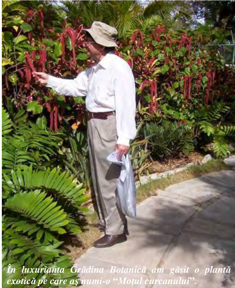
În luxurianta Grădina Botanică am găsit o plantă exotică pe care aș numi-o "Moșul curcanului".