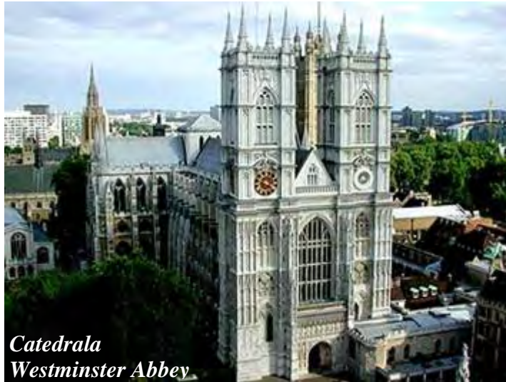
Catedrala Westminster Abbey

Aici se încoronau regii Angliei (38 monarhi, începând cu King Edward).