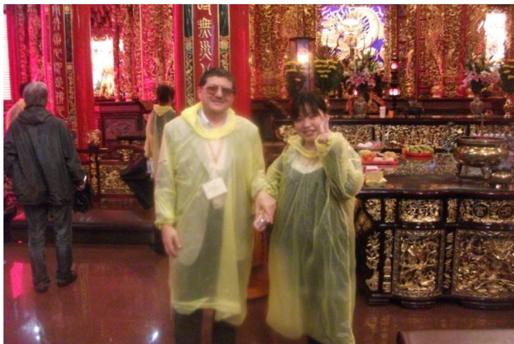
Într-un templu budist, la Kaohsiung, în Taiwan (2011)