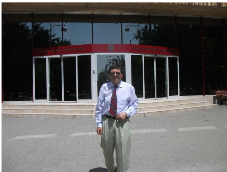
Florentin Smarandache, la Universitatea din Pecs (Ungaria)