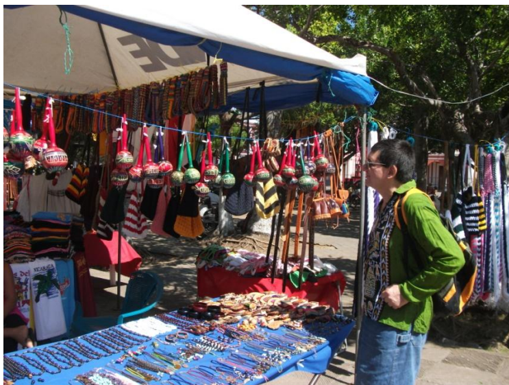
Florentin Smarandache în Granada (Nicaragua, 2010)