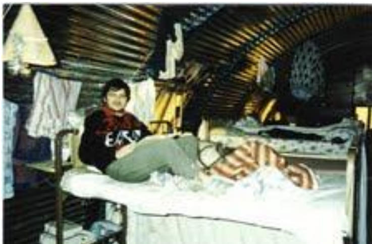
Florentin Smarandache, în lagărul de refugiați politici din Istanbul