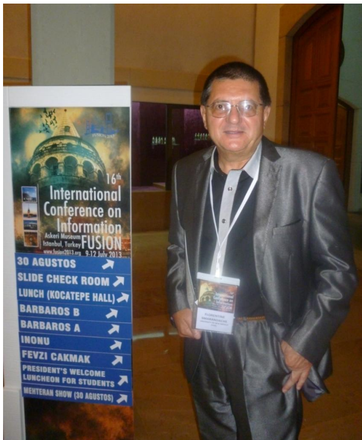
Florentin Smarandache, la un simpozion din Istanbul (iulie 2013)