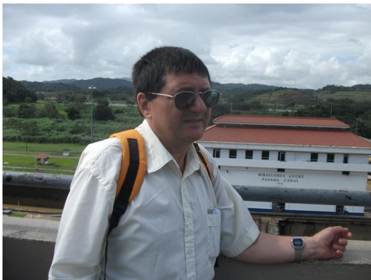
Florentin Smarandache, călătorul spre infinit (2012)

Florentin Smarandache este preocupat de paradox și întemeiază paradoxismul drept curent literar. Acest curent literar, credem, este primul din istoria literaturii care se bucură de un fundament științific. Cu aderenți în SUA, Australia, Asia, Europa etc., paradoxismul face figura unui tip revoluționar de gândire literar-artistică.