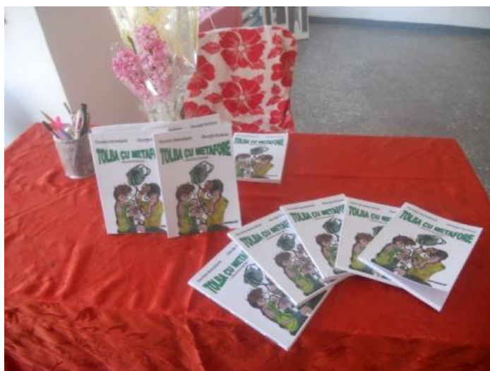
Volumul "Tolba cu metafore"