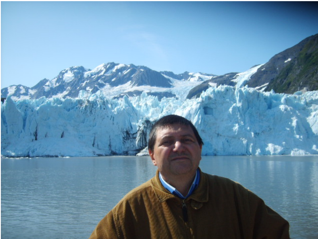
Ο Φλωρεντίν Σμαρανδάκε στην Αλάσκα(Αύγουστος 2009)

Ο Δρ. Φλωρεντίν Σμαρανδάκε είναι πολυμάθης : ως συγγραφέας, συντάκτης, μεταφραστής, συν-μεταφραστής, επιμελητής, ή συν-επιμέλητης σε 143 βιβλία και 183 επιστημονικές εργασίες και σημειώσεις .