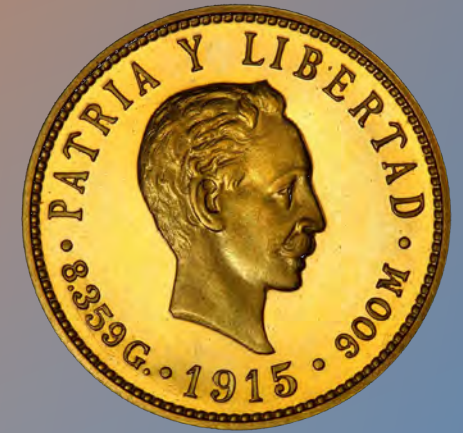
José Martí representado en la moneda de oro de 5 pesos cubanos de 1915.

con versos extraídos de poemas de José Martí