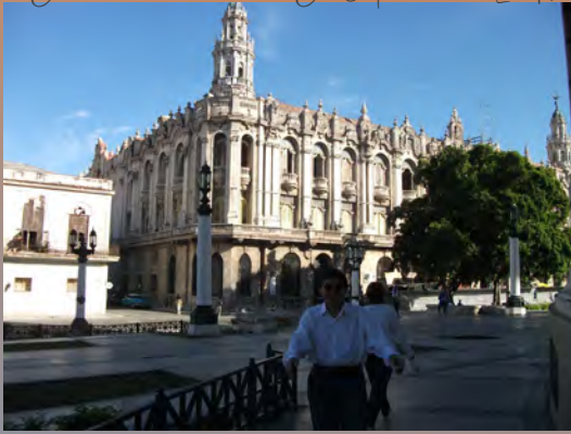
Gran Teatro de la Habana