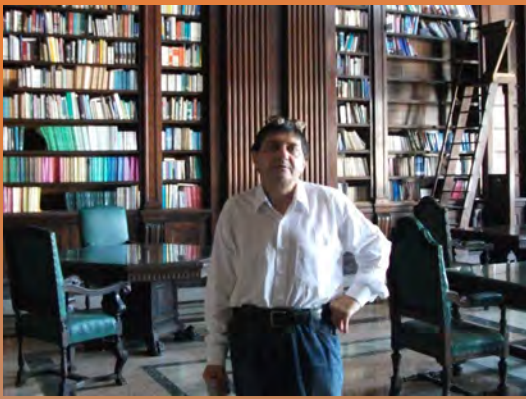
El autor, de visita en El Capitolio de La Habana